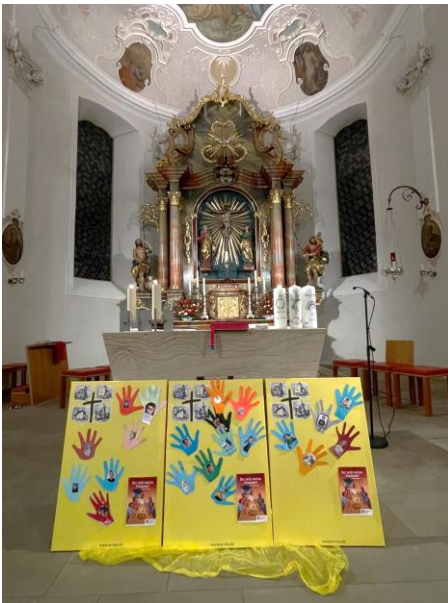
Plakate der Erstkommunionkinder 2026 von St. Johannes, Pax Christi und St. Remigius in St. Remigius