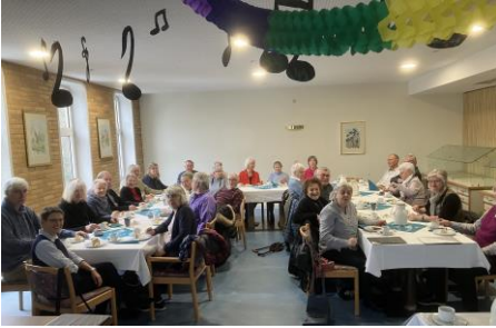
Kirchenchor beim Besuch der Seniorenresidenz in Bad Rappenau

Die gemeinsame Mitgliederversammlung beider Chöre fand am 10.02.2026 im Gemeindehaus Dahenfeld statt. Der Vorstand wurde entlastet und die Termine der Chöre in 2026 besprochen.