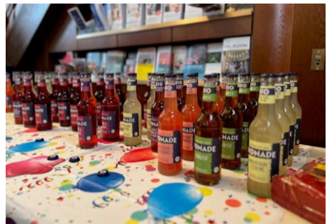
„Treffpunkt Kirche“ in St. Dionysius an Dreikönig – und am Faschingssonntag