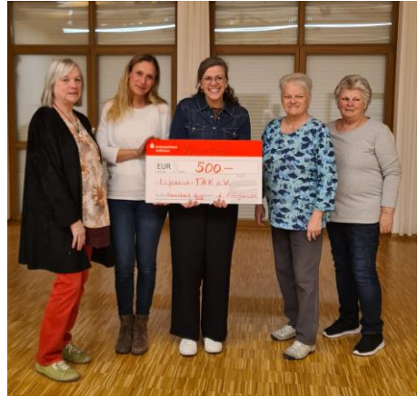
Spendenübergabe des Frauentreffs an „Lichtblick-TAK e. V.“