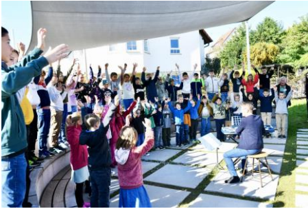
Familiengottesdienst anlässlich der Einweihung des „Grünen Klassenzimmers“ in der Grundschule in Dahenfeld (2025)

feiern. Ich persönlich freue mich immer sehr auf diese Donnerstage.