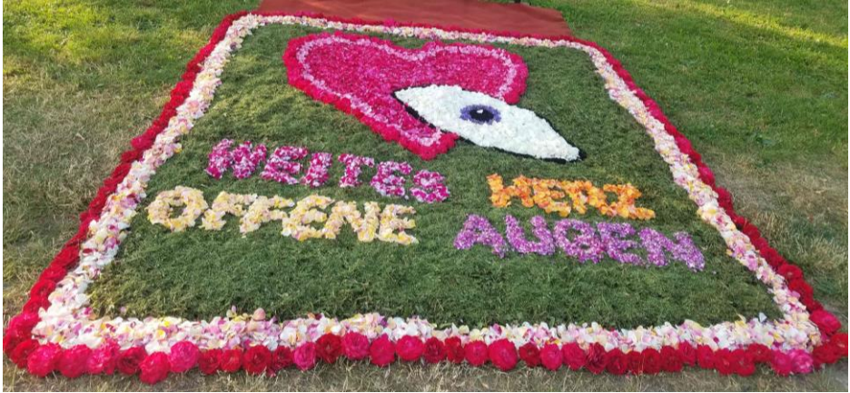
Blumentepich Fronleichnam 2023 bei St. Vinzenz