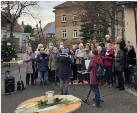
Kirchenchor bei der Eröffnung des 2. Dahenfelder Weihnachtsmarktes

Am 20. Dezember sang der Kirchenchor zur Eröffnung des 2. Weihnachtsmarktes in Dahenfeld anstelle des bisherigen Adventssingens.