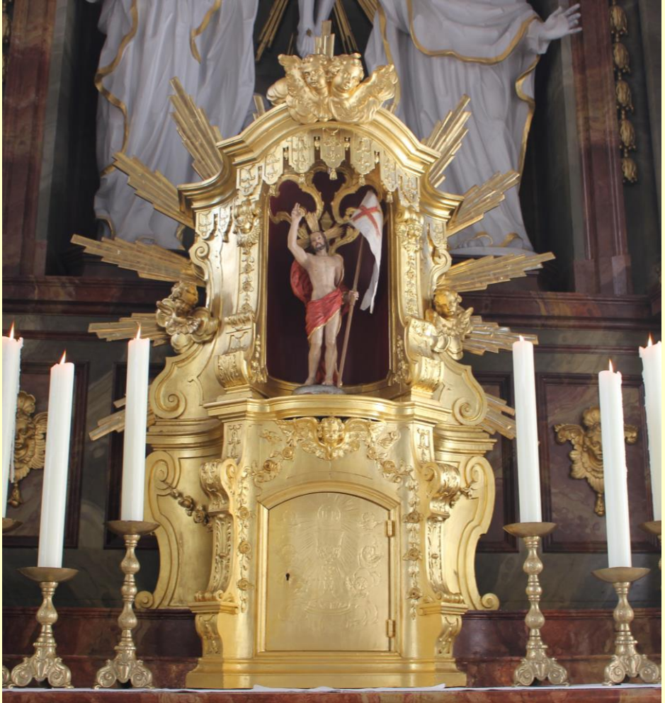
St. Dionysius, © Lea Wasser, 2019