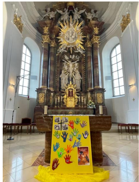
Plakat der Erstkommunionkinder 2026 von St. Dionysius in St. Dionysius