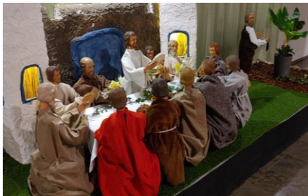
Ostergarten in Pax Christi (2024)

Auch in diesem Jahr wird der Ostergarten wieder ab Palmsonntag in der Kirche aufgebaut sein.